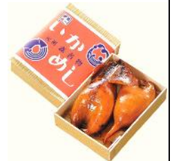
リファイン緑丘 森

高校時代から〇十年とお弁当を作り続けていますが(泣)私にとっておきは おばあちゃん直伝の“五平餅” のお弁当。くるみの香ばしさが昔から大好きです！