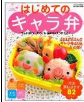
リファイン矢作 山本 大助