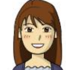
リファイン岡崎北 駒井

デパートで 北海道展 があるとついお弁当をみてしまいます。海鮮丼とか豪勢で旅行してないけど旅行に行った気分になるのでもいいかも？