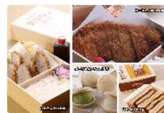
リファイン岡崎北 黒田

毎日4人分のお弁当を作るので、休みの日に たくさん作って小分け して冷凍しています。牛肉とごぼうの甘辛煮が家族には好評です。