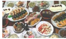
リファイン緑丘 森

子供の頃、お祭りの日は食卓に 御馳走 が並んでしかも 食べ放題 !! 嬉しかったなあ(´_`)