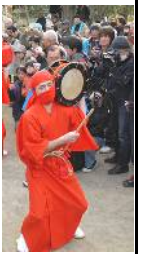
リファイン緑丘 黒田

近所で「 てんてこ祭り 」という奇祭が毎年お正月にあります。ただお正月は外出しないので、ニュースでしか見たことが無いです。