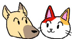
丸吉 と 豊子