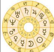
工務 山本 大助