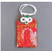
リファイン緑丘 原田

毎年祖母が 地元の神社でお守り を買ってきてくれるので、そのお守りをいつも持っています。おかげで病気や怪我もなく元気に過ごせていると思います。