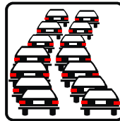
リファイン岡崎北 駒井

気候もいいので 山や川でBBQ がたのしそう。行き帰りに渋滞にならない場所はないかな～？