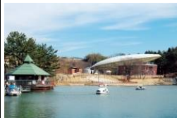
リファイン緑丘 原田

先日、豊田市の 鞍ヶ池公園 に行ってきました。無料で1日楽しめるのでお勧めです。私は100均でバドミントンやフリスビーなどを揃えて持って行きました。