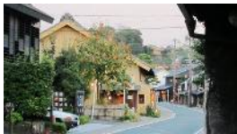
リファイン岡崎北 若杉

多治見オリベストリート 。私が好きな生活用具のお店、「tsunagu」があります。帰りに井ざわのおそば屋さんに 寄ってみては。