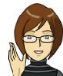
リファイン緑丘 森