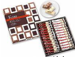
リファイン緑丘 若杉

沖縄土産の 紅芋レアケーキシュリ がとても美味しかったので、自分で沖縄に行った時に買ってお土産にしました。