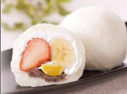
リファイン緑丘 原田