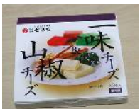
リファイン矢作 塚本

京都三年坂にある唐辛子屋さんの 唐辛子入りチーズ と物産展でよく買う北海道六花亭の マルセイバターサンド です。