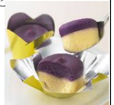
リファイン緑丘 森

加賀麩不室屋の宝の麩おすまし 器に入れてお湯を注ぐとお吸いものに！一見「もなか」に見えるのにお吸い物というところが面白くて、頂いたときに感動しました。形も可愛らしい詰め合わせです。