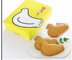
リファイン矢作 山本 大助