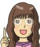
リファイン矢作 伊東

京都に行くとき必ず 土居志ばの在所漬 を実家を買っていきます。というか、父から頼まれます。ただ、頼まれる量がここぞとばかりに多いんです(泣)一度、着払いの宅配便で送ってしまいました(笑)