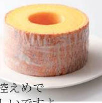
リファイン岡崎北 駒井