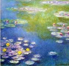
リファイン緑丘 原田