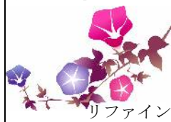
リファイン矢作 山本 大助