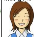
リファイン岡崎 早川

淡い青色の 額紫陽花 です。梅雨の時期は憂鬱ですが、雨上がりの雨粒がキラキラした紫陽花が好きです。