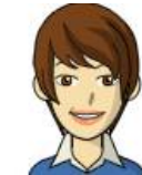
リファイン緑丘 若杉