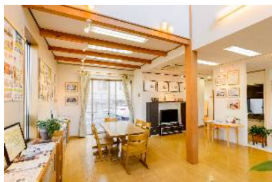
リファイン岡崎北