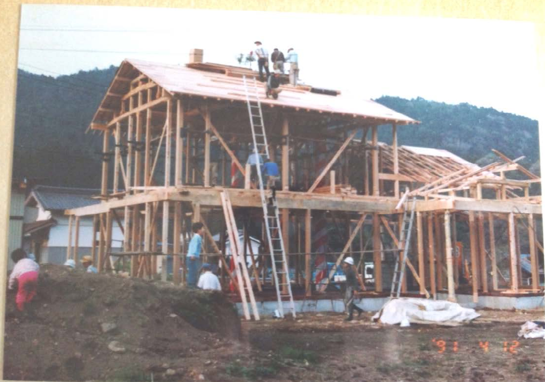
(上写真)25年前の上棟式の写真です。左端に写っているのが、25年前の私です。