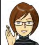
リファイン緑丘 森