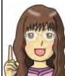
リファイン緑丘 伊東

夏にニューヨークに行きます! 美術館にブロードウェイにセントラルパークに他にもいろいろ! 行きたいところが多すぎて困ってます。