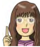
リファイン緑丘 伊東