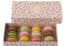
リファイン岡崎 榊原