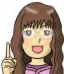
リファイン緑丘 伊東