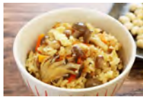
リファイン緑丘 森