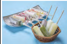
リファイン緑丘 森