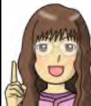
リファイン緑丘 伊東